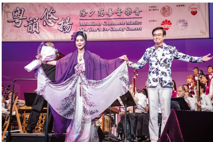
鄭文雅與黃百鳴演唱《劍合釵圓》