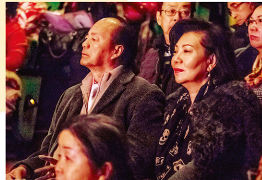
狄龍與太太一同出席欣賞音樂會