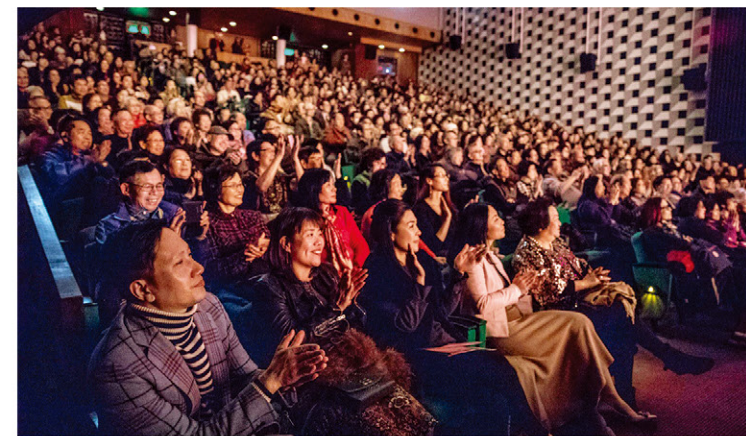
當晚全院滿座，感謝每位入場的觀眾

如果說，嶺南的二胡(南胡)，需要演奏家來構建它的粵味，或更廣義上的嶺南風格，那麼，上述的一點回憶，那些實驗，都值得大家繼續去思索。