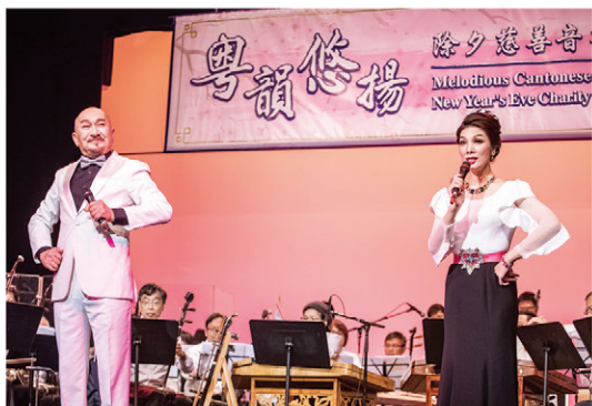
麥嘉(左)與粵劇名家蘇春梅(右) 合力演唱《我的刁蠻公主》