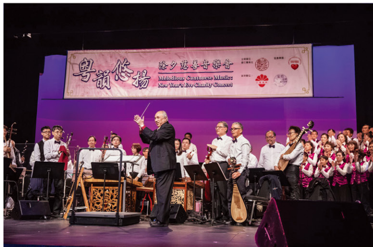
支持單位小雅樂軒超過65人參與演出