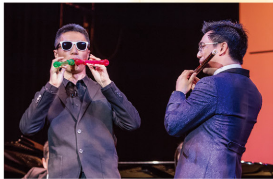
紫荊樂團演出者以中西樂器演出多首粵語流行曲，包括：《好歌獻給你》、《當年情》、《Monica》