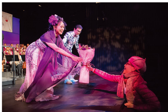
不少觀眾向表演者獻花