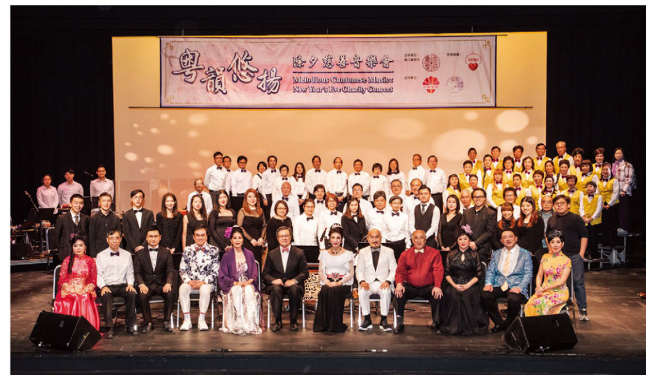
當晚參與演出者逾80人，共襄善舉！圖為全體大合照。